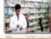
Un pharmacien صيدلي